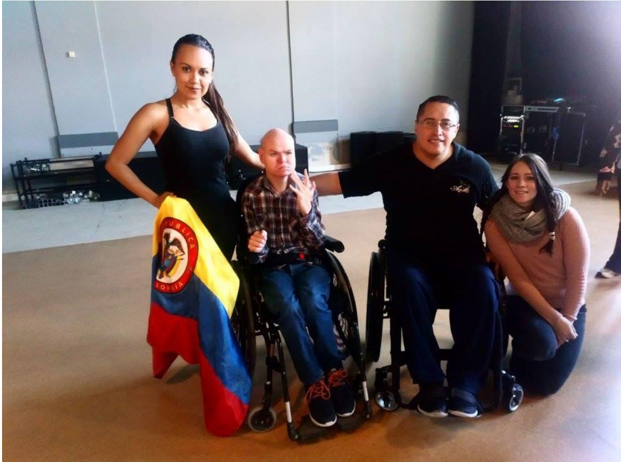
Organisasjonen AZNAD og Korpus-medlemmer på workshops innen dans og bevegelse