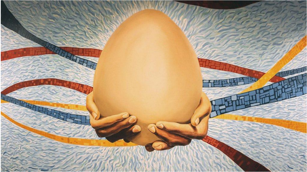
Colombianernes bidrag til Gjøvik med murprosjektet, som ble gjennomført på Musikkfolkehøgskolen Viken