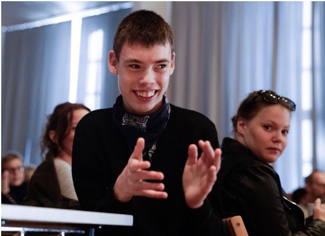
Simen med rytmelære