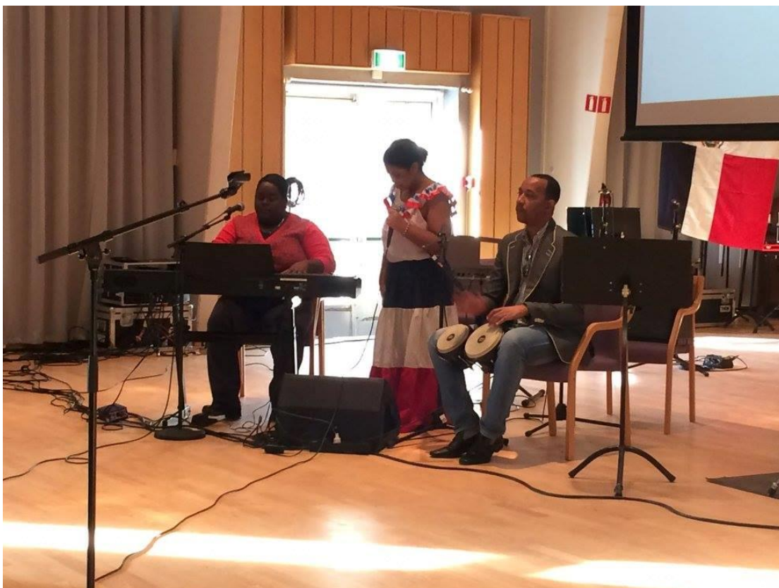
Pascalgruppen fra Den Dominikanske republikk