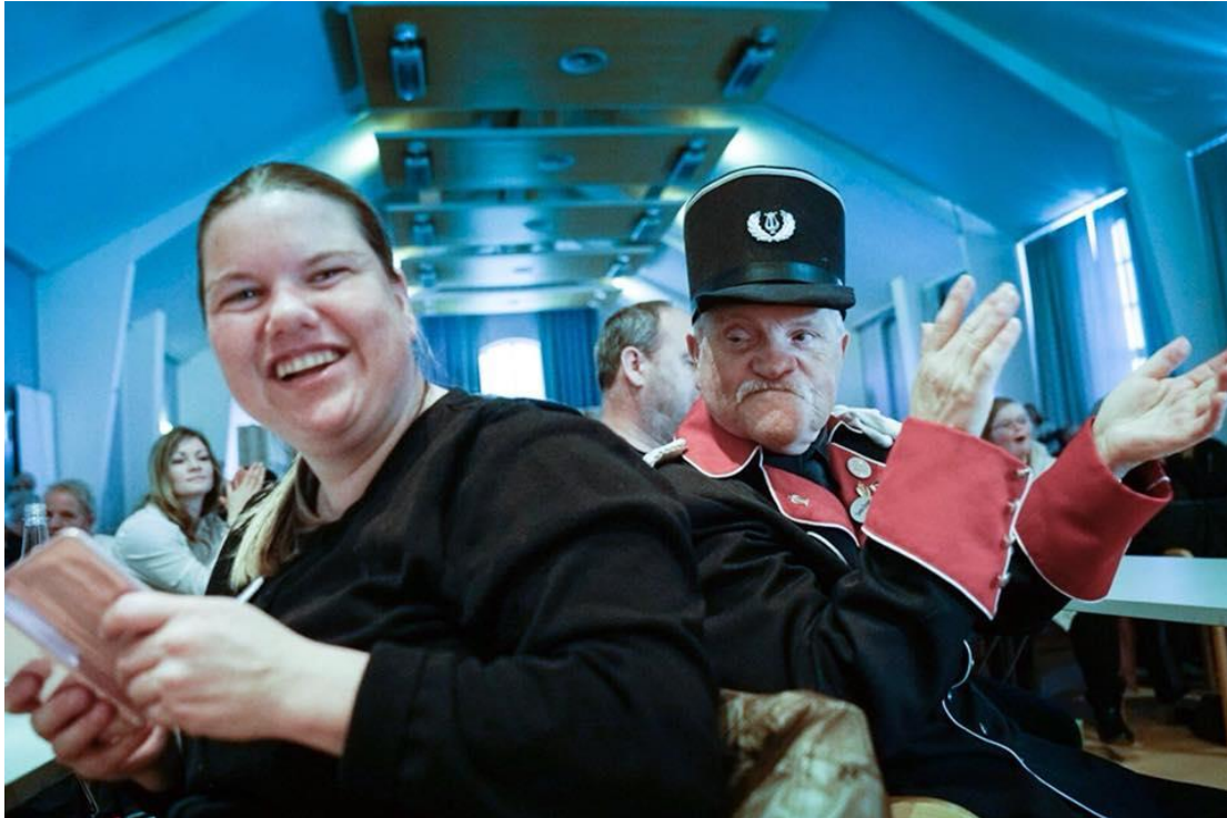
Workshoppedeltakere fra Korpus på Gjøvik