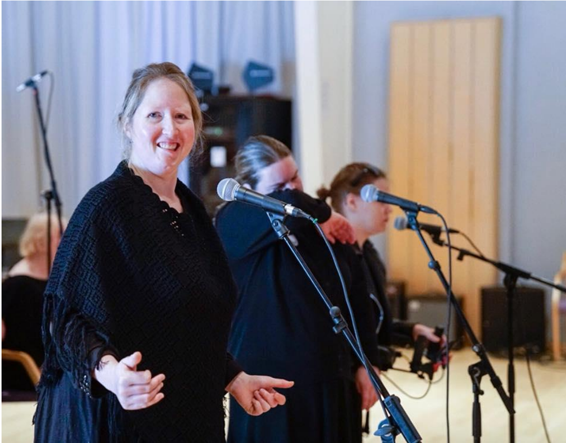
Workshopsdeltakere med korundervisning