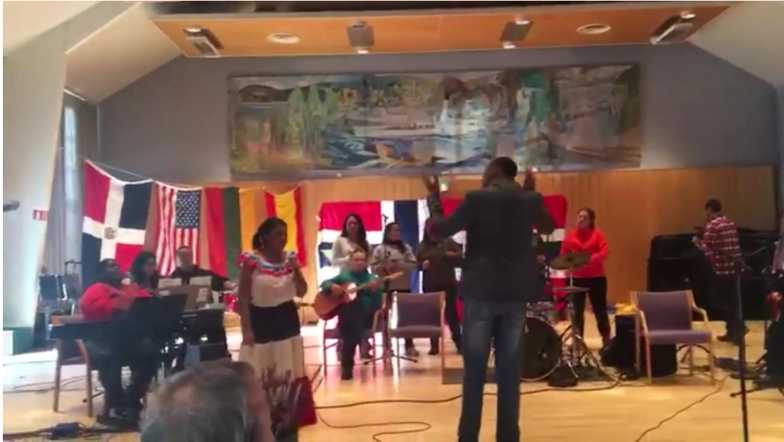
Resultat av workshops vises i Gjøvikhallen med internasjonale gjester fra bl.a. Den Dominikanske republikk