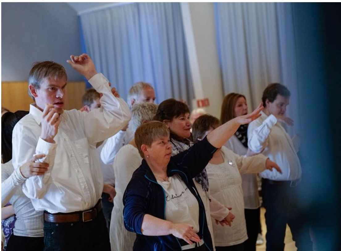
Gjøvik's eget Korpus i sving