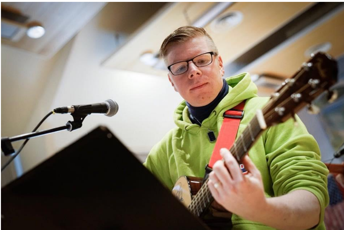
Pascal Rockers's gitarist