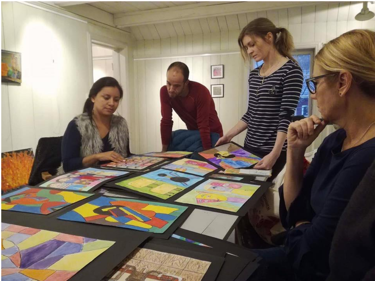
Forberedelser til kunstutstilling