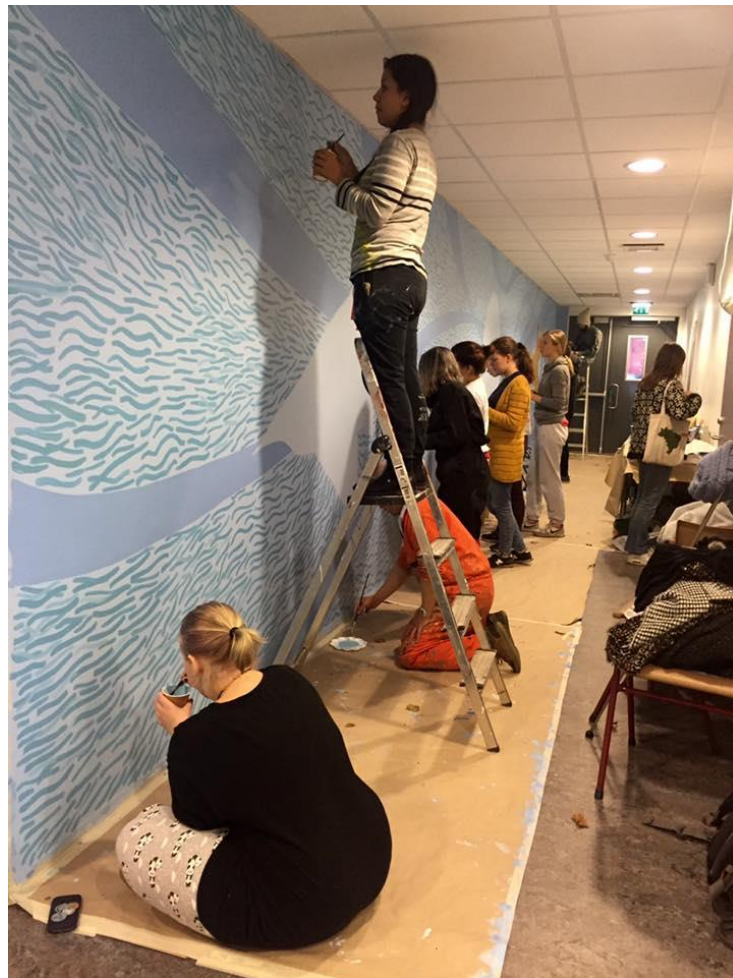
Arbeid med murkunstprosjektet